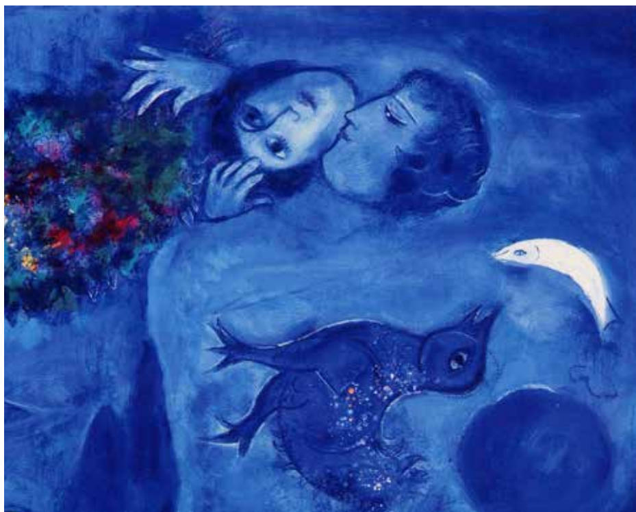
Lovers with half moon (Marc Chagall, 1926)