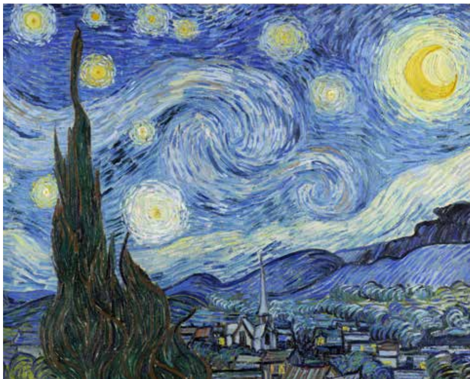
Notte Stellata (Vincent Van Gogh, 1889)

S.C. Chirurgia Oncologica Muscolo Scheletrica Patologica - INT IRCCS Fondazione Pascale Napoli