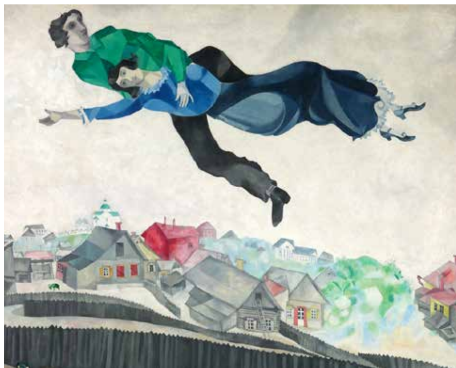
Sulla città (Marc Chagall, 1918)